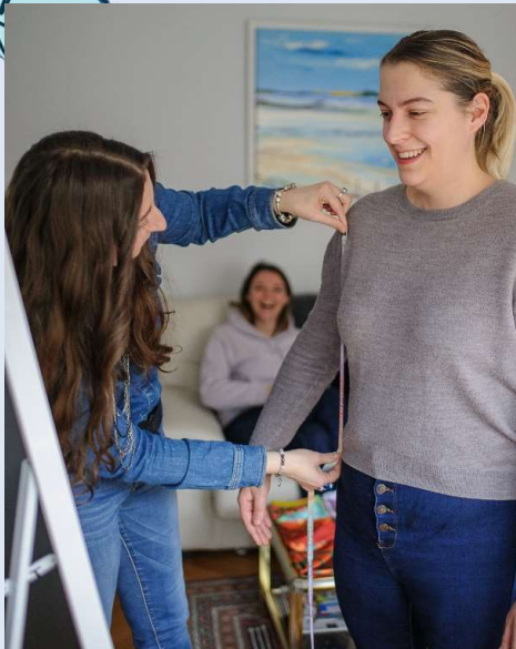
Atelier morphologie : Découvrir sa morphologie corps