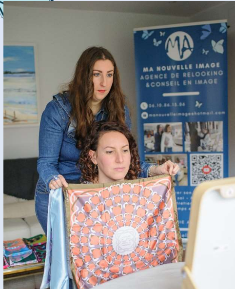
Atelier colorimétrie : Découvrir ses couleurs